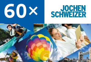
1.000 € Erlebnis-Gutschein