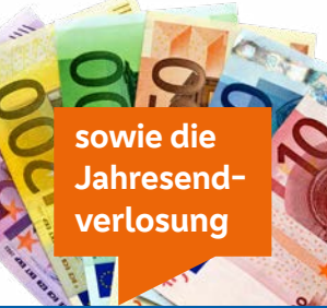
sowie die Jahresend-verlosung Zusätzlich im Dezember