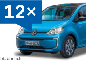
Abb. ähnlich VW e-up!